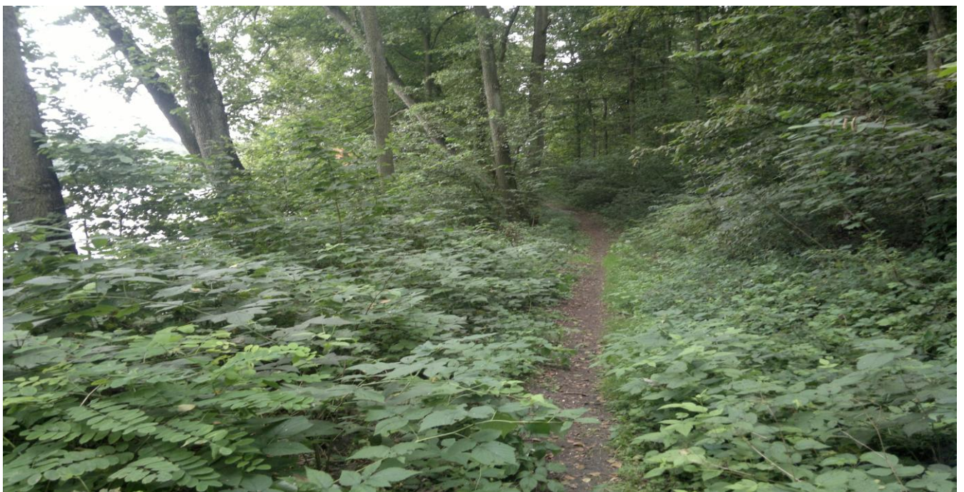
Wąski czerwony szlak rowerowy przy końcu jeziora