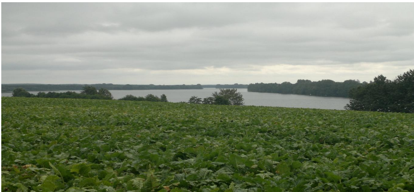
Widok na Jezioro Kamienieckie od strony Łosośników